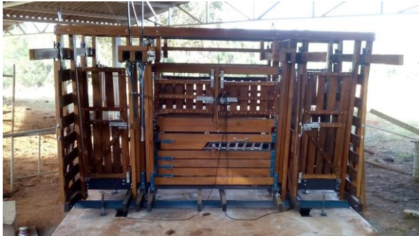
1) Tronco de pesagem