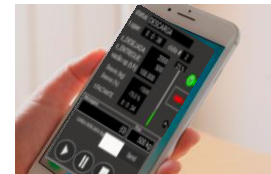
3) Aplicativo RAEC para Smartphone